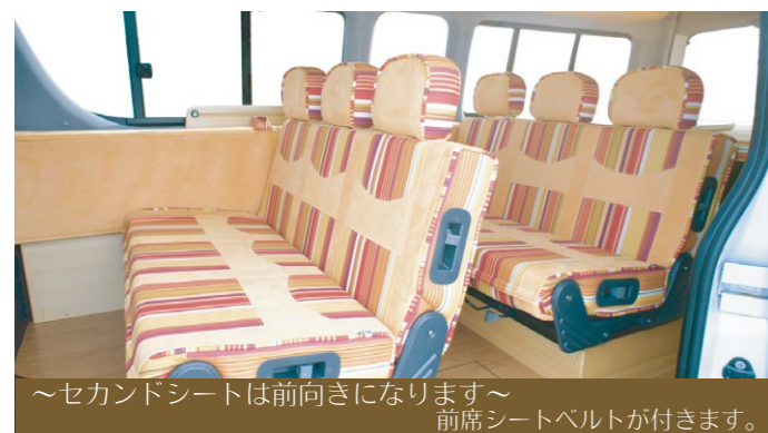
～セカンドシートは前向きになります～ 前席シートベルトが付きます。