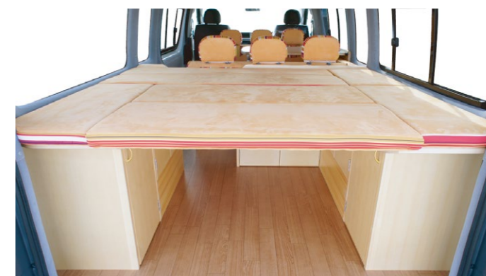
ベッド下は大容量カーゴスペース！