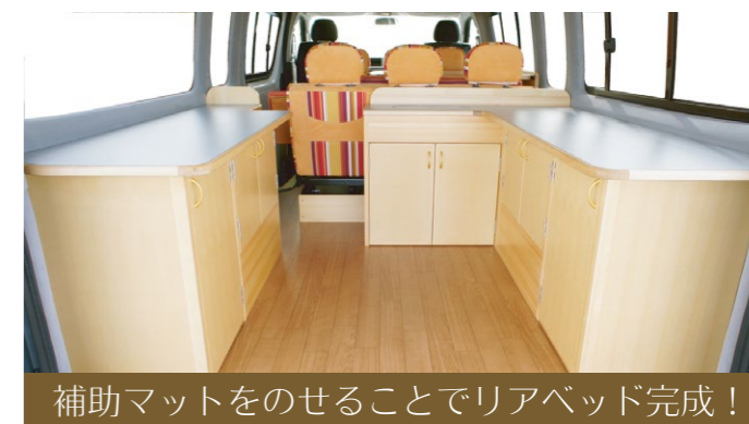
補助マットをのせることでリアベッド完成！