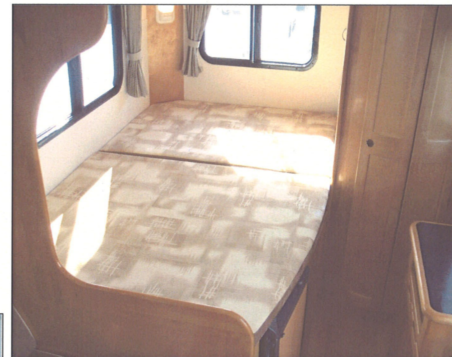
広々としたゆとりあるリアベット 1960×1230mm