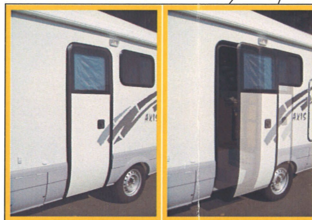
グライドオートドア（自動ドア） リモコン付き