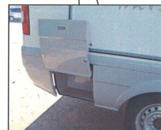
スイング開閉式 外部収納庫