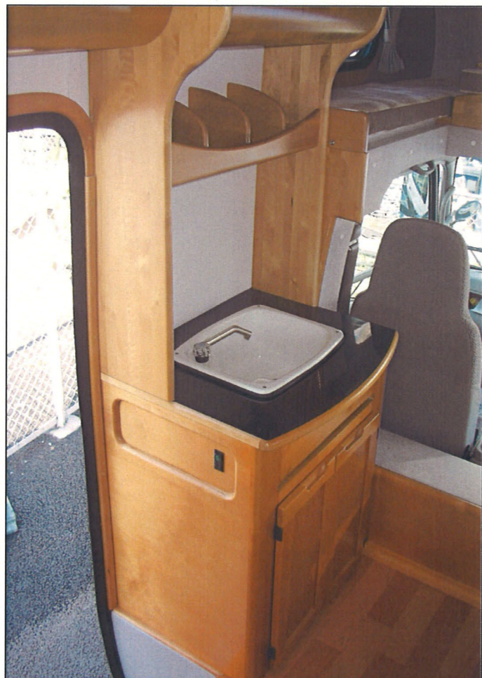
キッチン&収納庫 12V40L 冷蔵庫を標準装備