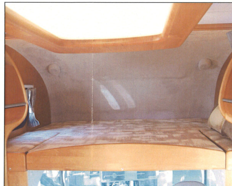
広々としたバンクベット (1800×1450mm)