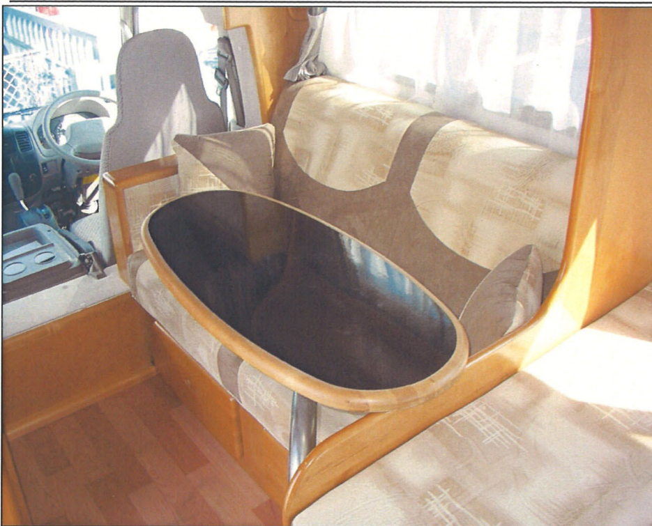
ゆったりとしたサイドソファ。スイング式のテーブルはリアベットでも使用できます。

A toZが平成3年に初めて製作したキャブコンを「アクシス」と名付け以来、アラモ、アーデンなど様々なキャンパーを製造してきました。今回、AtoZが初めて製作した一体成型ボディキャブコン「アクシス」は一体成型では不可能とされていた硬質ウレタンをボディ全体に取り付けパネル工法と同等の高断熱ボディを実現したAtoZの最新の技術を導入した1台です。その他にもグライドオートドア（自動ドア）やスイング開閉式外部収納庫など初代「アクシス」の名に受け継ぐ新しい技術が濃縮されたキャンパーです。