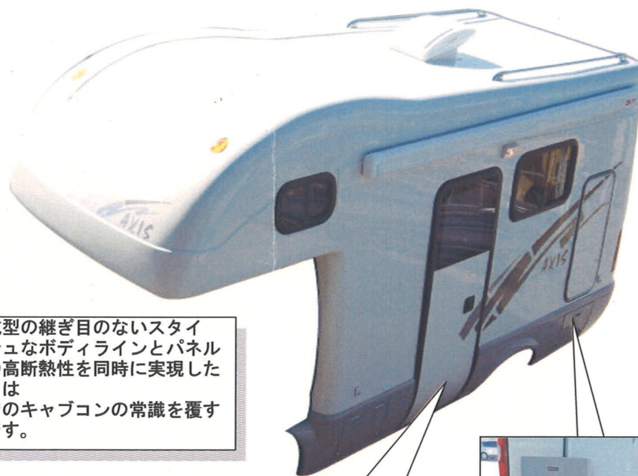
一体成型の継ぎ目のないスタイリッシュなボディラインとパネル工法の高断熱性を同時に実現したボディは今までのキャブコンの常識を覆す1台です。