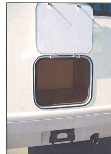
収納各種 トイレルーム ベット下など収納容積も 非常に高くなっています