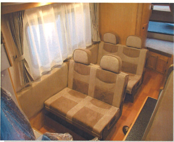
走行中はシートを前向きにできます。