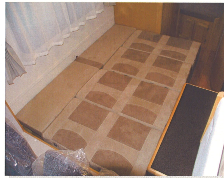
広々としたゆとりあるフロアベット 1900×1250mm

一体成型の継ぎ目のないスタイリッシュなボディラインとパネル工法の高断熱性を同時に実現したボディは今までのキャブコンの常識を覆す1台です。