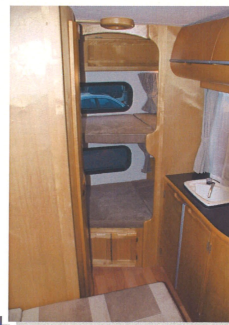
リア2段ベット 上1800×630×700mm 下1840×660×640mm