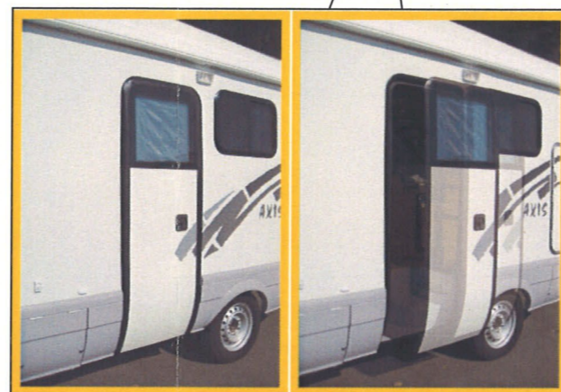
グライドオートドア（自動ドア） リモコン付き