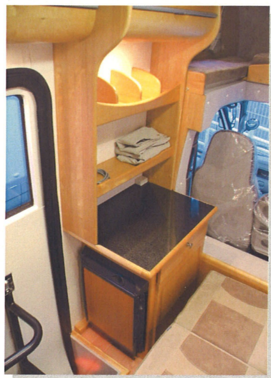
12V 40L 冷蔵庫を標準装備