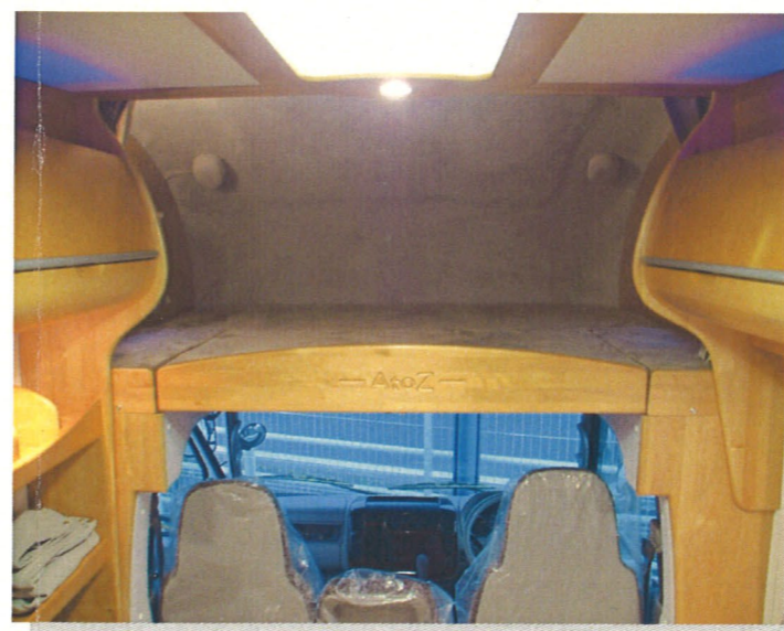
広々としたバンクベット (1800×1450mm)