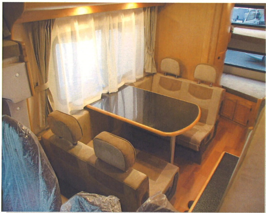
ゆったりとしたサイドソファ。スイング式のテーブルはリアベットでも使用できます。