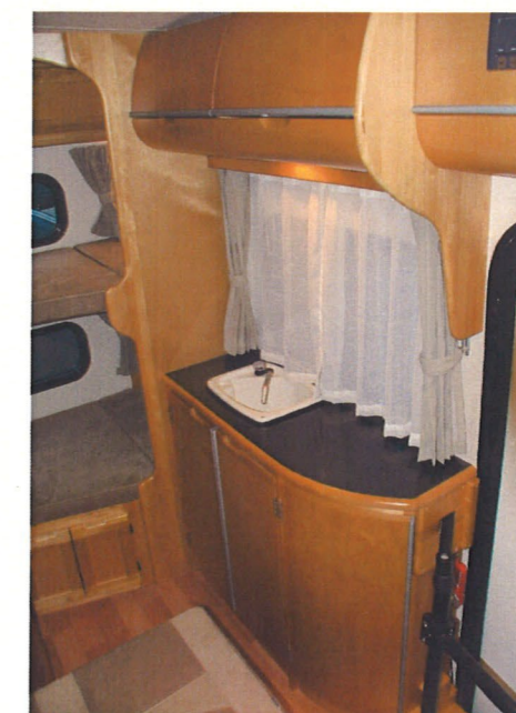
ゆとりの収納庫のあるギャレー