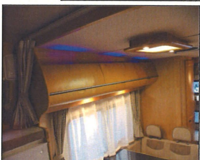
間接照明付きキャビネット