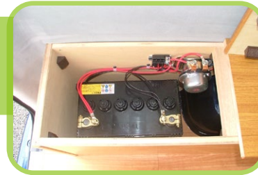
サブバッテリー&走行充電