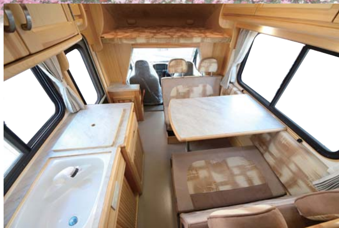
大型テーブルに向かって4人がゆったり座れるダイネット

全長4620mm全高2500mmの街乗りにも最適なコンパクトボディ。 ミニバンライクなアレンは運転席助手席エアバック、ABSが標準装備。 毎日乗りたいた方に嬉しい燃費の良さ (10km/1L) 楽々ドライブの低いシートポジションも特徴です。 月日が経つ程、味が出る天然木から成るインテリア。 常設2段ベッドも装備したレイアウトは大切な人と長く乗る事に適しています。