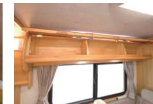
ルーフサイドには充実した扉付き収納庫