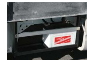
サブバッテリーはサイドスカート内、セカンドシート下に走行充電システムを装備