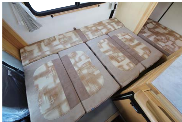
シートを展開しサブマットを入れるだけで1880×1225mmのベッド