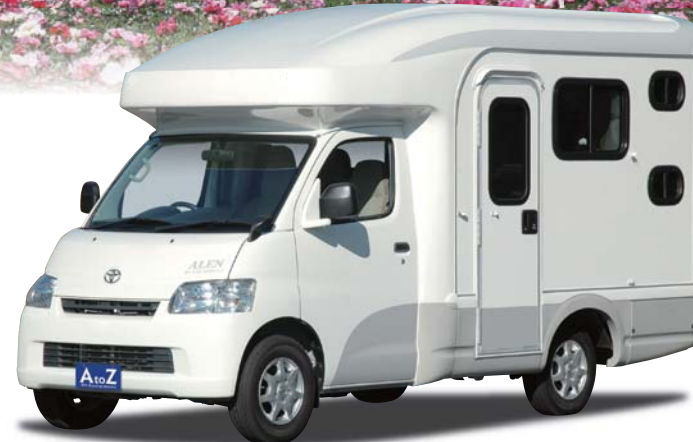
※車の写真はオプション装着車です。また、仕様等は変更することもあります。