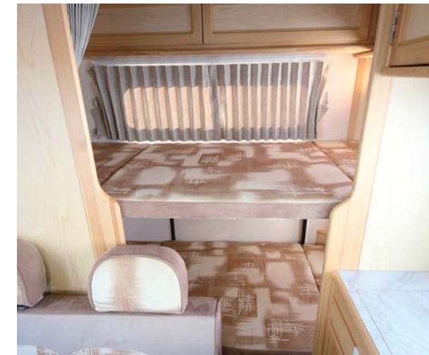
ワイドなリヤ常設2段ベッドは1740×700mm2段