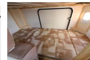
リヤベッドマットを取り外すとリヤ大型バゲッジドア (800×800mm) からもアクセス可能な大きな収納庫