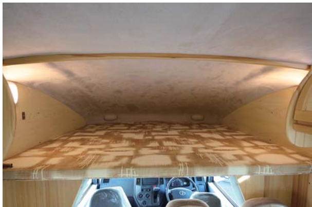
バンク部1600×1370mmは寝具収納やチャイルドベッドとして使用可能

充実したキッチンには40L (12V) 冷蔵庫をビルトイン。蛇口は引き出して外でも使えるシャワーフォーセットタイプ。引き出し収納、延長テーブル、給排水 (各20L) タンク、AC100Vコンセント、電子レンジも標準装備