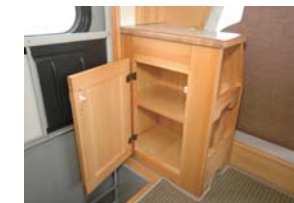
エントランスドア横のゲタ箱収納庫