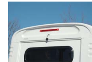
バックカメラも標準装備