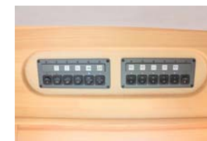
エントランスドア上部に室内電源の集中スイッチ