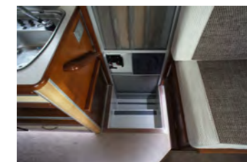
ステップ 足下はLEDが点灯しますので夜間でも安心。