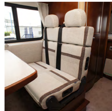
セカンドシート 3点式シートベルト着用。