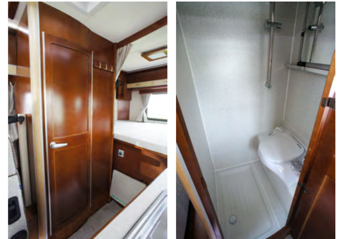
トイレシャワールーム 温水シャワー&カセットトイレ