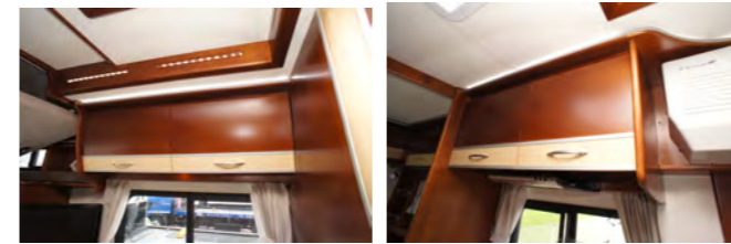
キャビネット ルーフ両サイドの他にリアの常設ベッド上にも装備。