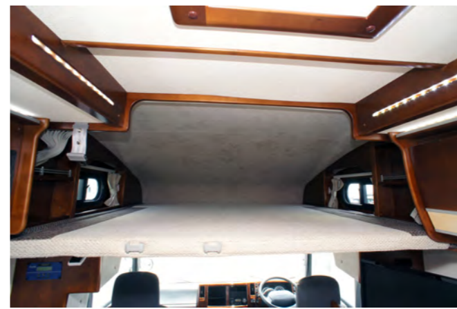
フルダウンバンクベッド 簡単操作でいつもでも横になれます。size:1740x1800mm