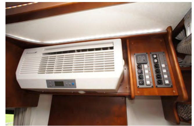
Air conditioner i-Cool ICL 製 i-cool を標準装備。