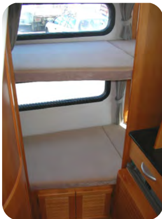
常設2段ベット 上 2020×700×720mm 下 2020×700×740mm