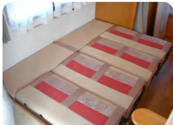
セカンドシートは走行中は前向きになります。1900×1300mmのベット展開も可能です。