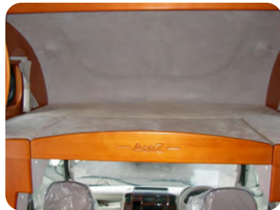
1900×1400のゆとりのサイズ