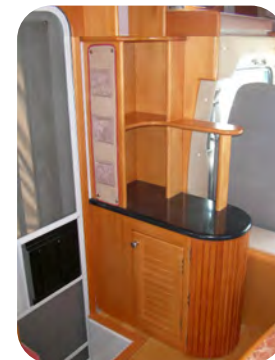
バンクベトルダーを兼ねたシューズボックス&TV台