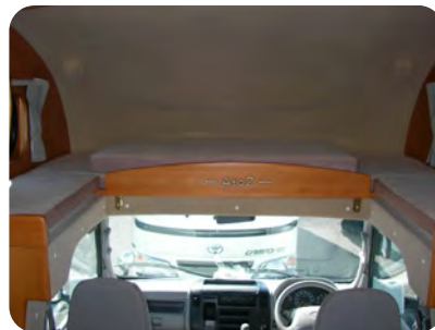
広々としたバンクベット 走行中はスライドをさせて視界もひろびろ