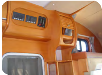
集中スイッチパネル& バンクベットグローブボックス