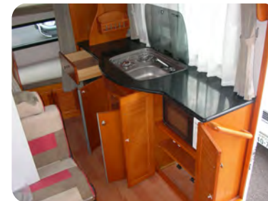
収納の豊富なカウンターキッチン 使い勝手も良い仕様となっています。 12V40L冷蔵庫、レンジフード、 ガラス蓋付きバーナー一体型シンク を標準装備。