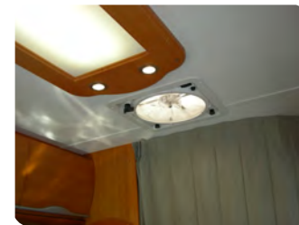
MAX ファン (大型換気扇) を標準装備