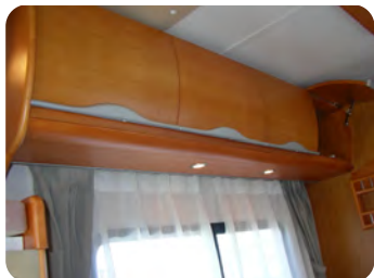
ルーフキャビネット