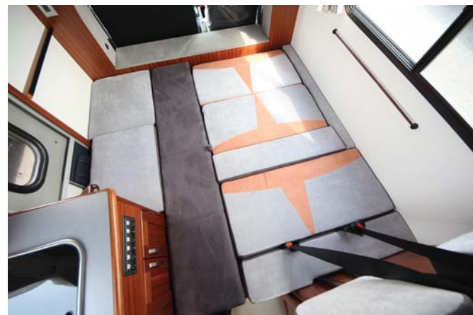
▶_フロアベッド size : 1300×1820mm