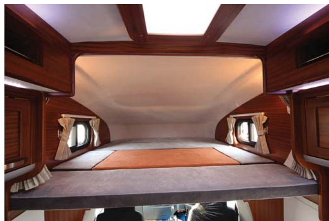
▶_バンクベッド size : 1740×1880mm