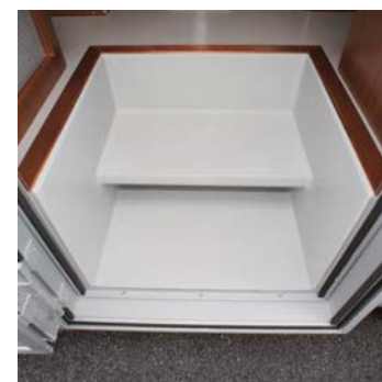
▶_ステップ 広いステップは靴の脱ぎ履きがとても便利に使えます。