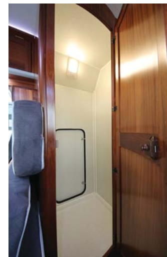
▶_マルチルーム size : 790×720×1880 (H) mm トイレを置いてトイレルームとして使えます。