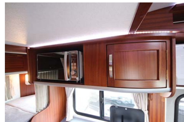
▶_電子レンジ (標準装備)