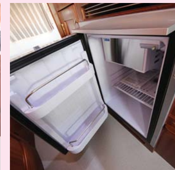
▶_冷蔵庫 49L 製氷棚付きで氷も作れます。