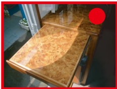
■便利な延長テーブル