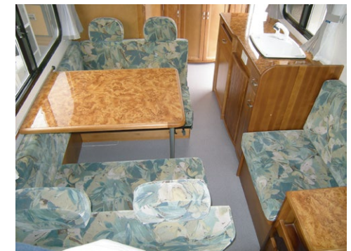
広々としたダイネットは リアエントランスならではの・・・