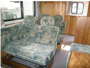
走行中はセカンドシートは前向きになります。