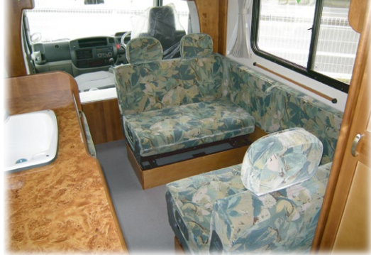
使いやすさを追求したリアエントランスモデル