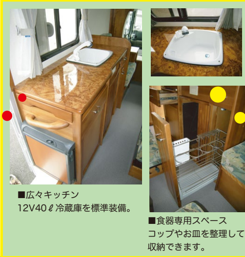
■広々キッチン 12V40ℓ冷蔵庫を標準装備。