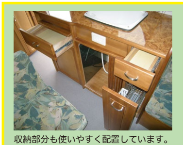
収納部分も使いやすく配置しています。