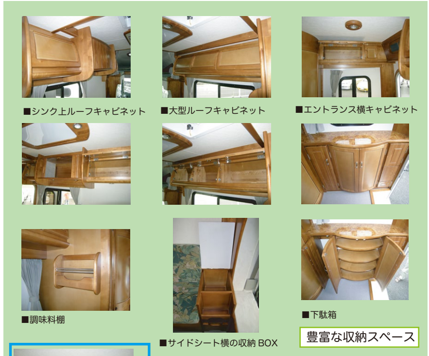
■シンク上ルーフキャビネット

写真はアトラスショートボディー 2WD AT ディーゼルターボ を使用しています。またオプション装着車です。