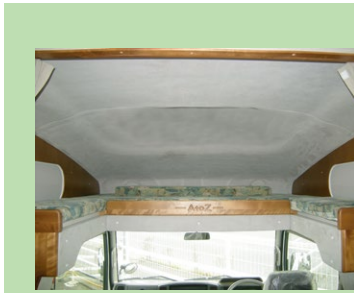
バンクベットは引き出して空いたスペースにマットを入れれば完成。