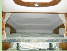
補助マットをプラスすることでさらにスペースを確保。 ■バンクベット 1860×1740×580mm