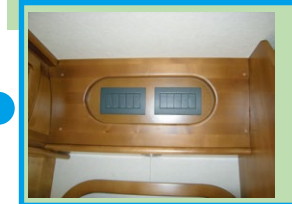
■集中スイッチパネル エントランス上にあります。