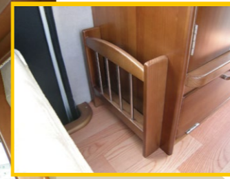
マガジンラックはここ