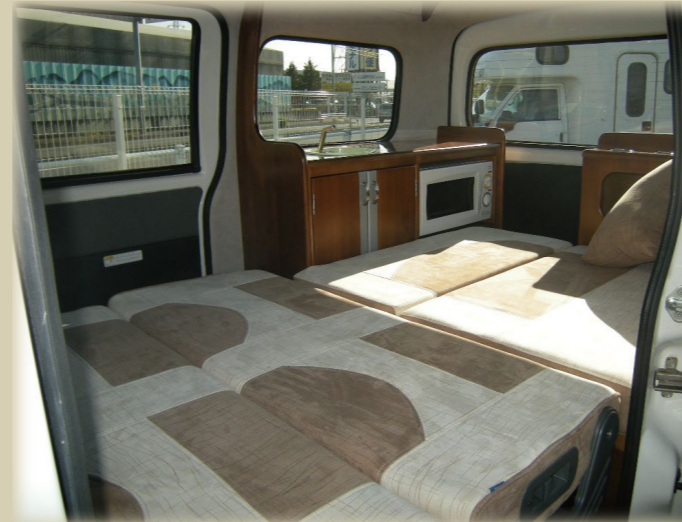
ベッドスペースは簡単メイキング (※ベッドサイズは裏面に記載しております。)