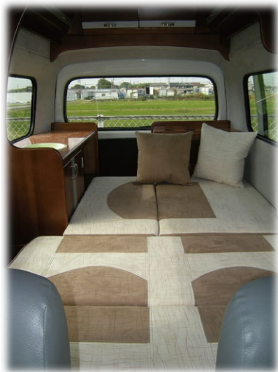
大人2人が就寝可能