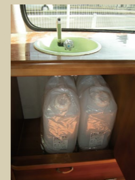
■10L 清 / 排水タンク

停車時はシートを後ろ側にしてダイネットは完成! 大人5人まで座ることができます。