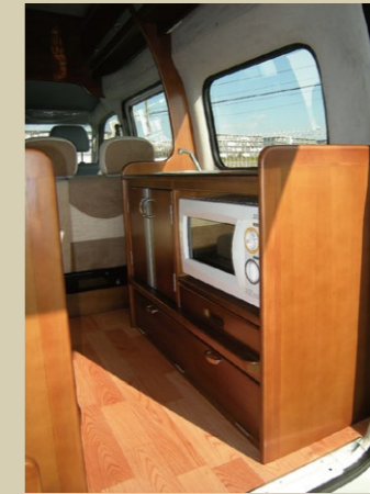
コンパクトなギャレー (電子レンジが標準装備)