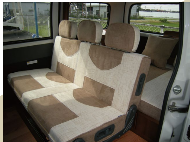
シートは固めで座りごこちは抜群!