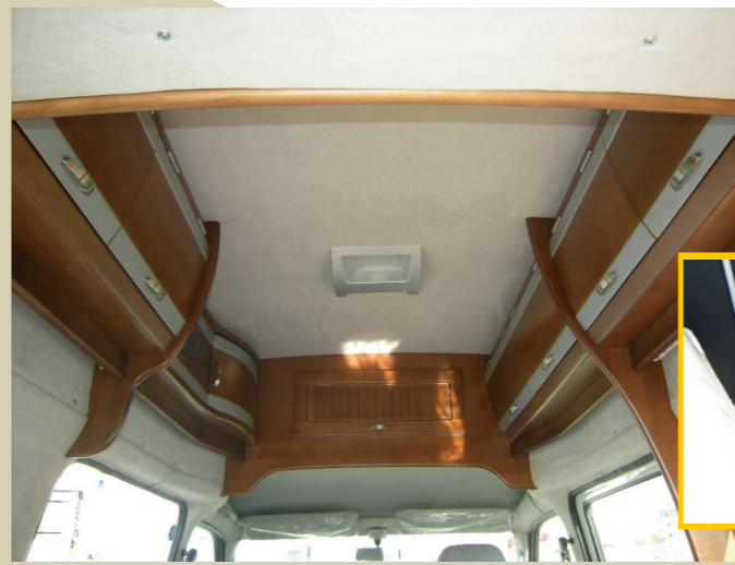
豊富な収納棚 (14カ所)