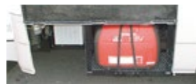
■1.6kw 発電機も収納可能 (インバーター・発電機はオプションです)