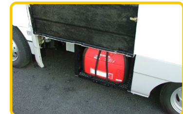
1.6Kw 発電機も収納可能な外部収納庫 (インバーター・発電機はオプションです)