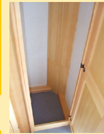
■大型クローゼット エントランス右には大型クローゼットが備え付けられています。