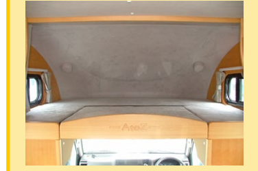
引出し式バンクベットの運転席からのウォークスルーがとてもスムーズです (バンクベット 1800×1420×650mm)