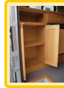
■シューズボックス エントランス左にはシューズボックス