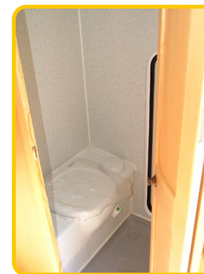
シャワー設備 (OP) も設置できるトイレルーム トイレはオプションです