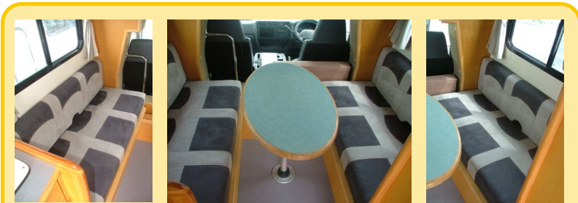
ベットメイクも楽々のダイネットベット (1830×1300mm) ボックスよりスノコを出してマットをのせれば出来上がり。テーブルをつけた状態でもベットになりますのでお座敷のようになります