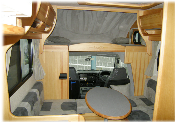
■ダイネット 対面式サイドソファタイプのダイネット (1300mm) 大人4人がゆっくりろ座れる広さです。

AtoZの最新の技術とノウハウを凝縮したコンパクトキャンパーアミティに全て2人で使うことを前提とした『RR』が誕生しました。街中でも取り回しの良い4600mmのコンパクトなボディでもゆとりの設備が驚くほど充実しています。家具類は天然木材を使用しホルマリン系接着剤を使用しない体に優しい落ち着いた雰囲気のある室内、リアWタイヤと強化された足回りは安定した走行性は初めてのキャンピングカーでのふたり旅をサポートする最高のツールとなるはずですよ。