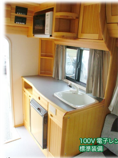
100V 電子レンジを標準装備