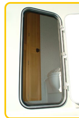
トイレルームには外部から荷物のアクセスが出来る大型バグジドアを装備