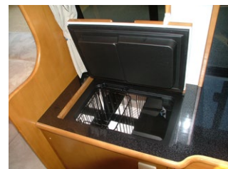
■12V 上蓋式冷蔵庫 (40L)