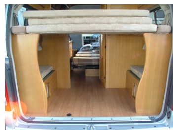
ベットを外すと 1120×860mmの カーゴスペースに