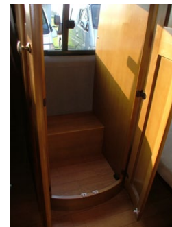
■ゆとりのマルチルーム