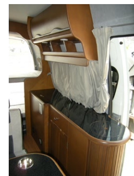
■ルーフキャビネット