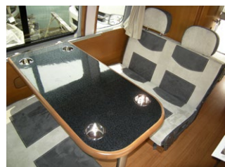
■カップホルダー付き テーブル