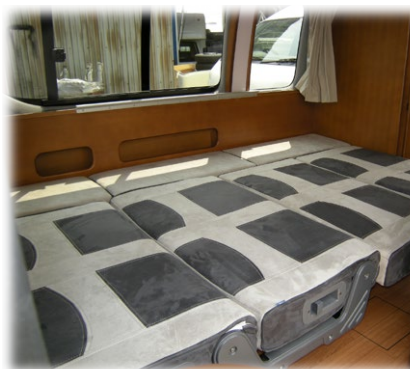
■ひろびろフロアベット 1880×1200mm