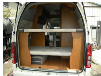
■リア2段ベット 上：1760×900mm 下：1720×800mm