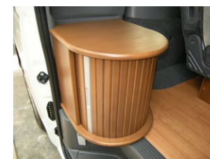
■シューズボックス