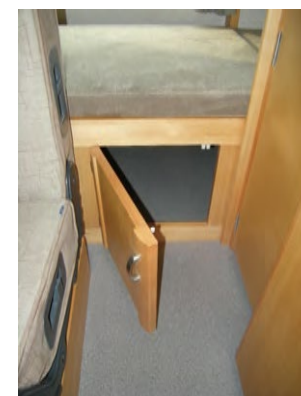
二段ベッド下の扉