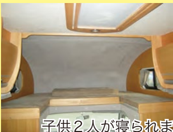
子供2人が寝られます。