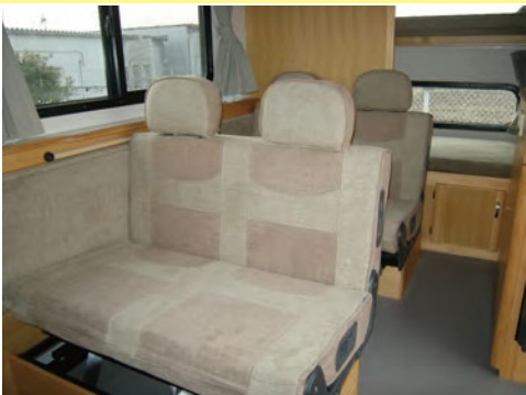
走行中はセカンドシートは全席前向きになり 全席シートベルトが付きます。