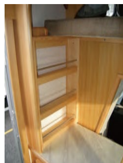
■下駄箱上の収納棚