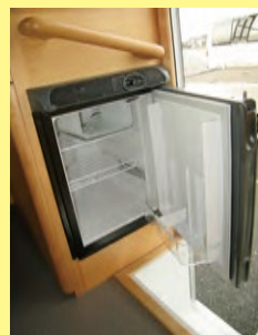
■12V40L 1WAY 冷蔵庫