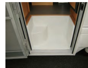
乗降りを考え低くおさえたステップ