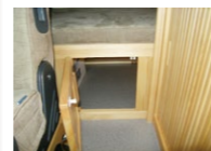
■二段ベット下収納扉