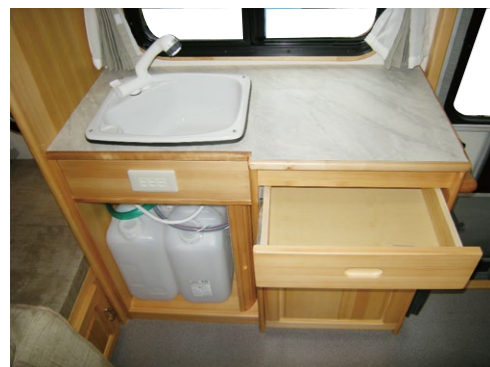
■シンク&ギャレー 20L 清/排水タンク