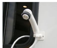
■シャワーヘッド 専用のフックにかければ外部シャワーとして使用できます。