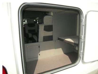
■二段ベット下収納スペース