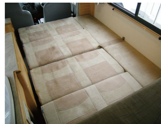
■フロアベッド サイズ：1880×1225mm 大人二人が就寝できる広々スペースを確保。