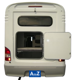
■大型リアバゲッジドア