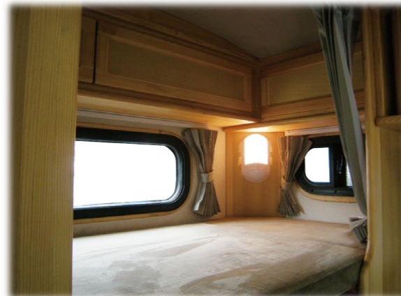
■二段ベット上収納棚