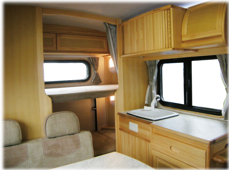
■シンク&ギャレー 使いやすさを優先した配置。