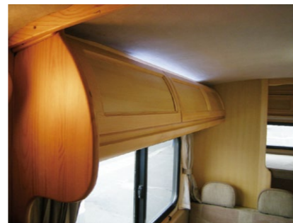
■キャビネット (LED 間接照明付き)