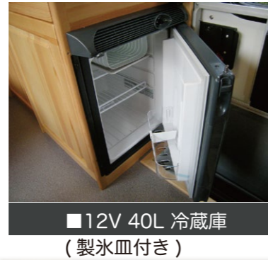
■12V 40L 冷蔵庫 (製氷皿付き)