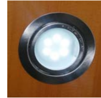
■スイッチ付きLEDダウンライト