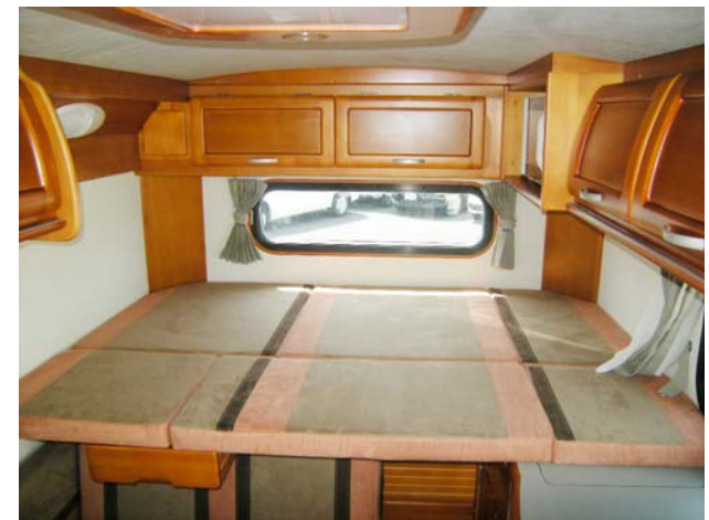
■常設ベッド (延長時) size. 1,750×1,170mm