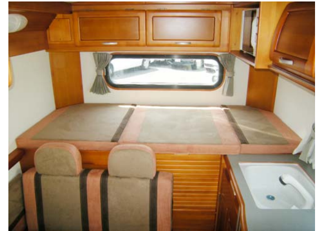
■常設ベッド size. 1,750×760mm