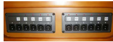
■集中スイッチパネル