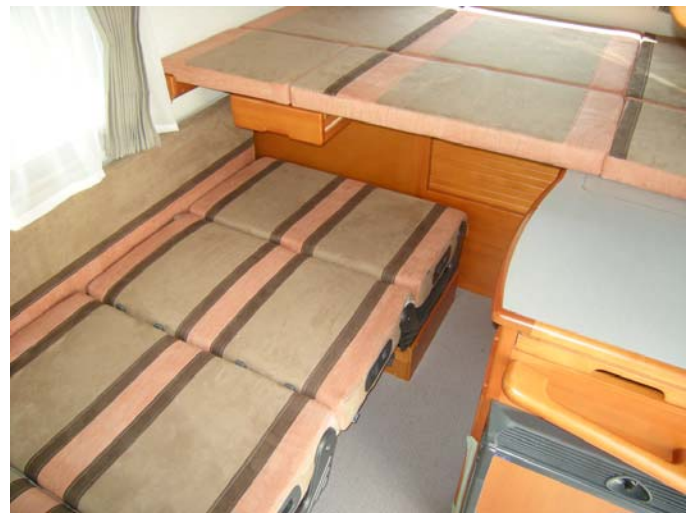
■フロアベッド size. 1,880×1,225mm