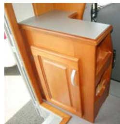
■シューズボックス