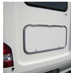
■ベッド下収納スペース