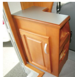
■シューズボックス