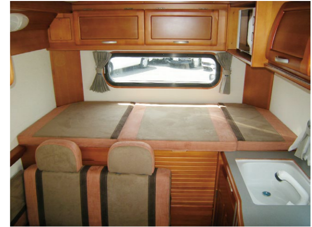
■常設ベッド size. 1,750×760mm