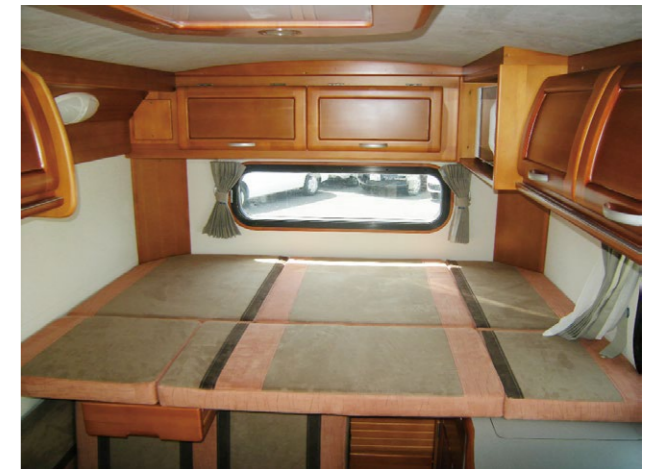
■常設ベッド (延長時) size. 1,750×1,170mm