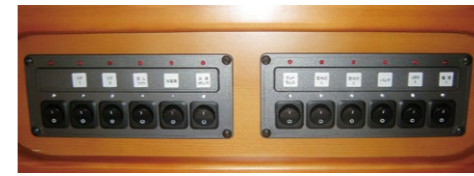
■集中スイッチパネル