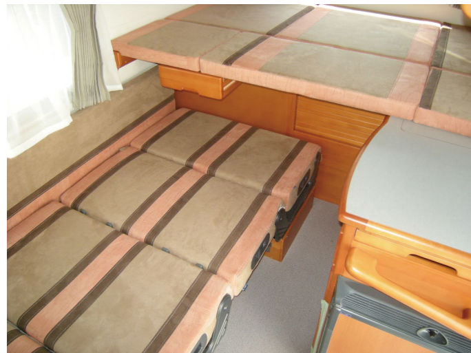
■フロアベッド size. 1,880×1,225mm