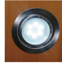
■スイッチ付きLEDダウンライト