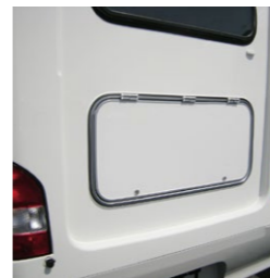
■ベッド下収納スペース