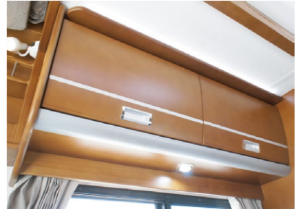
大きなキャビネットは使い方も色々