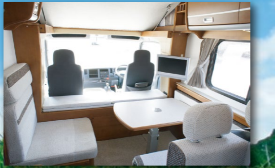
●ダイネット 広々室内空間