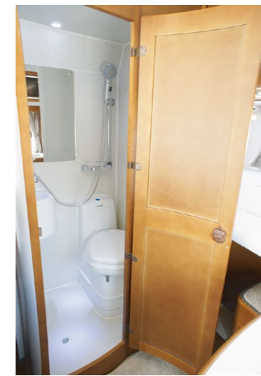
●温水シャワー & カセットトイレ