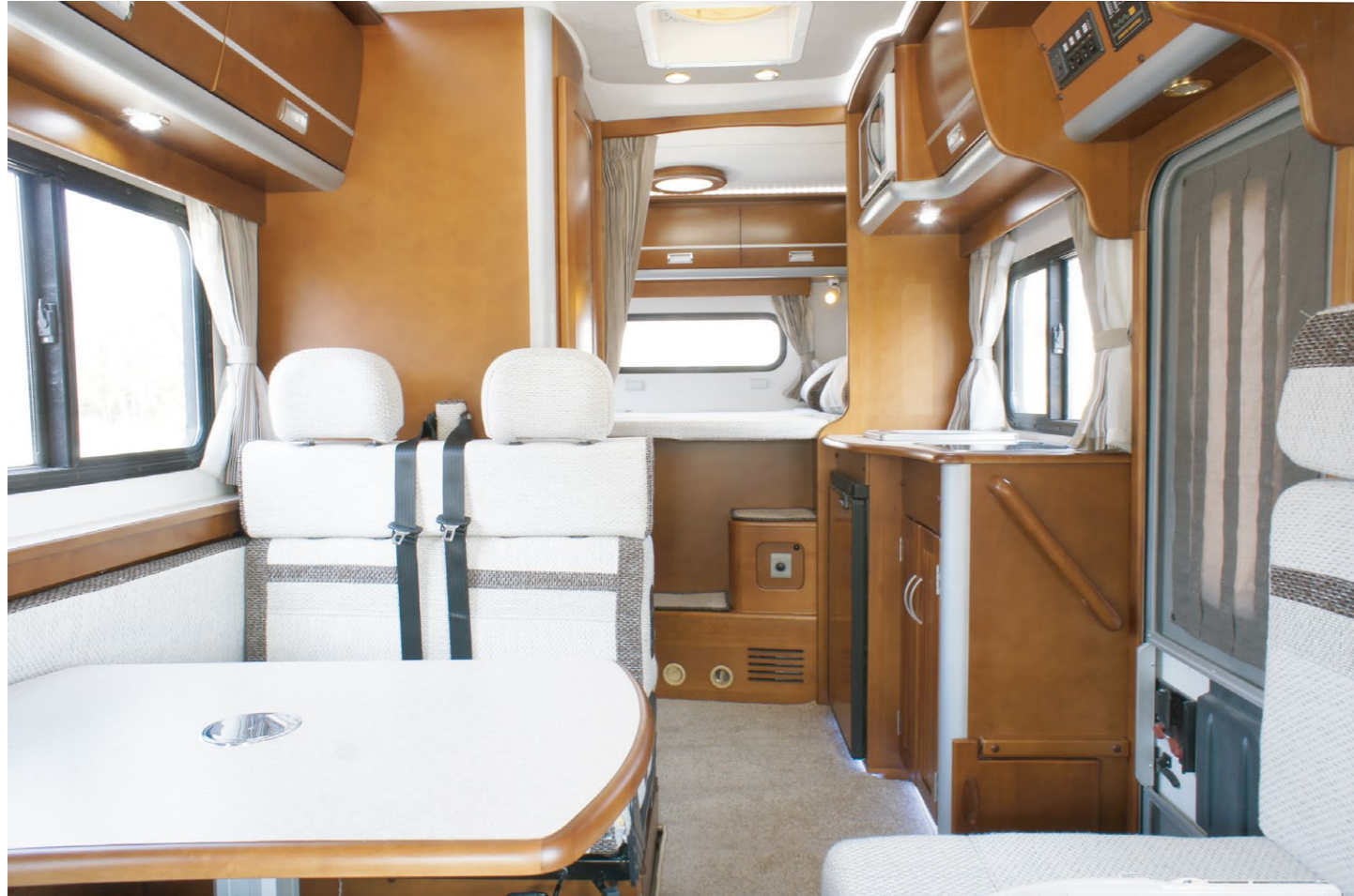
●セカンドシート (3点式シートベルト着用)&ベンチシート