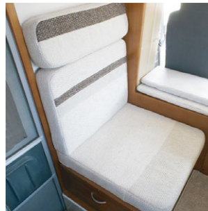
●横向きベンチシート