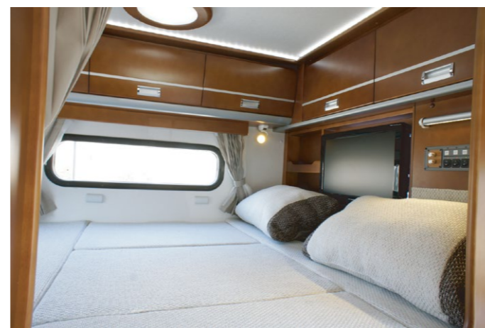
調光器付きのLEDで素敵な雰囲気演出